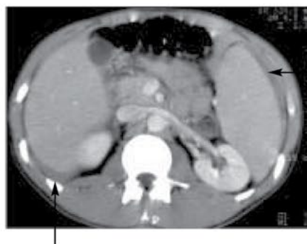
Abbildung 2. Behandlungsstrategie der spontanen Milzruptur.

Abbildung 1. Spontane Milzruptur bei Mononucleosis infectiosa. Splenomegalie, perisplenische und perihepatische Flüssigkeit als indirekter Hinweis auf die Ruptur (Pfeil). Erfolgreiche konservative Behandlung.